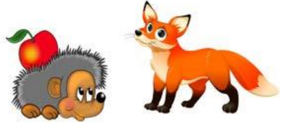
ежа с лисой