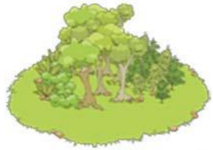
в лес пошел густой,